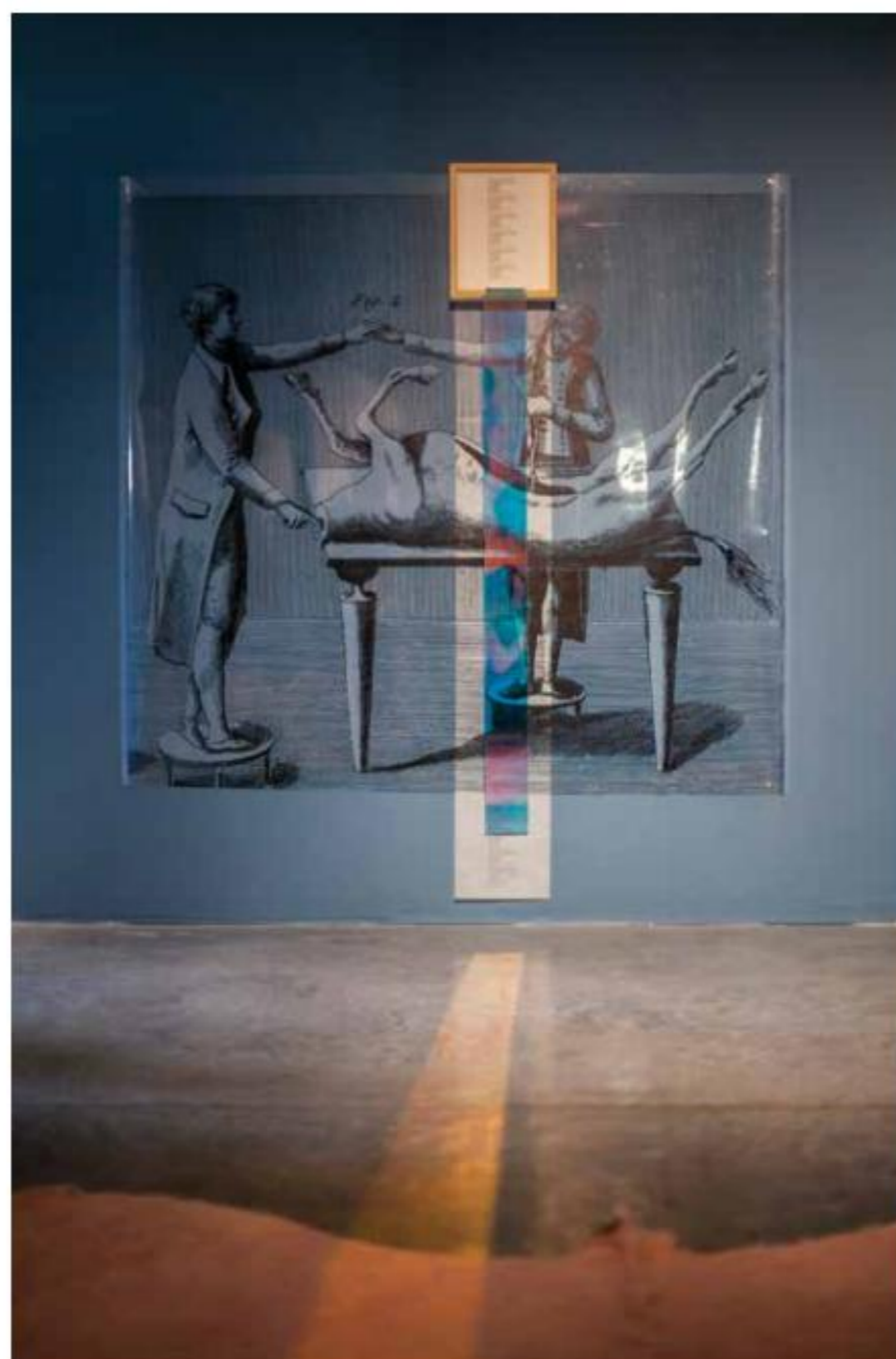
MANIOBRAS DE UN TERCETO

Fotografía, arte conceptual, performance... sea cual sea la técnica, el poder de conectar con públicos de todas latitudes es innegable. F