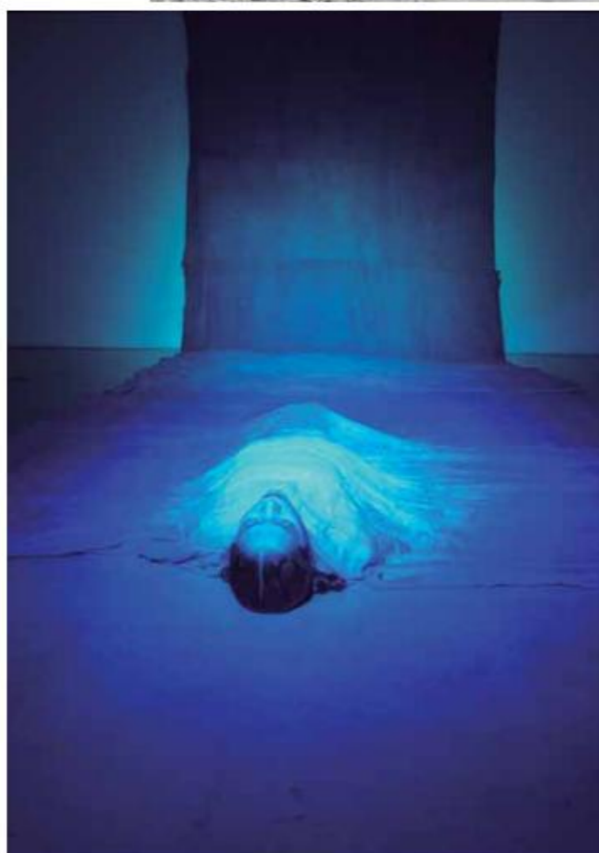
EL AGUA SE VOLVIÓ ORO...

Instalación-Performance 2019. Sandra Monterroso.